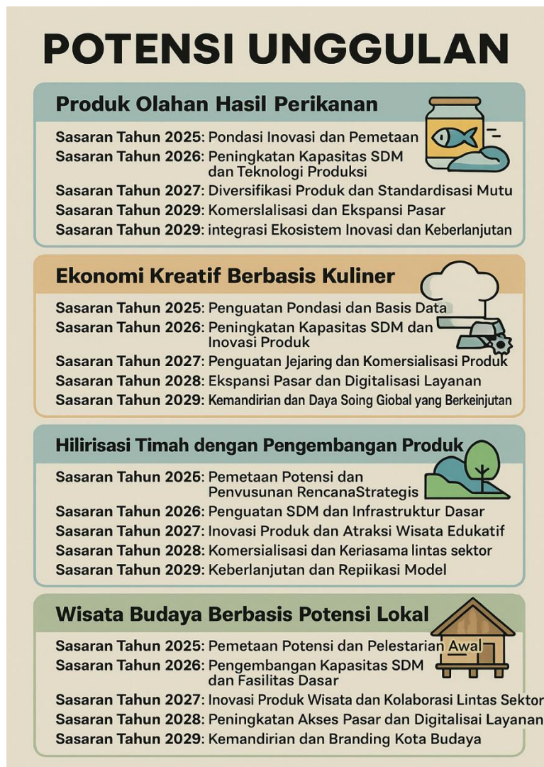
Gambar 6.1. Sasaran Strategis Tahun 2025-2029 dari Produk Unggulan Kota Pangkal Pinang