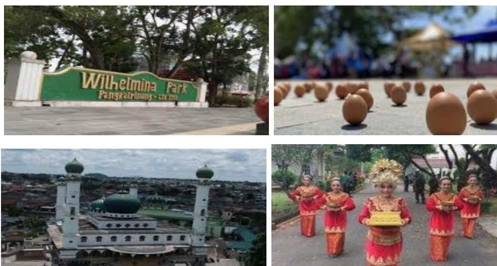
Gambar 2.19 Wisata Budaya

Pengembangan wisata budaya di Tua Tunu diharapkan mampu melestarikan warisan budaya lokal sekaligus mendukung pemberdayaan masyarakat setempat, sehingga memberikan dampak positif bagi ekonomi dan identitas budaya Kota Pangkal Pinang.