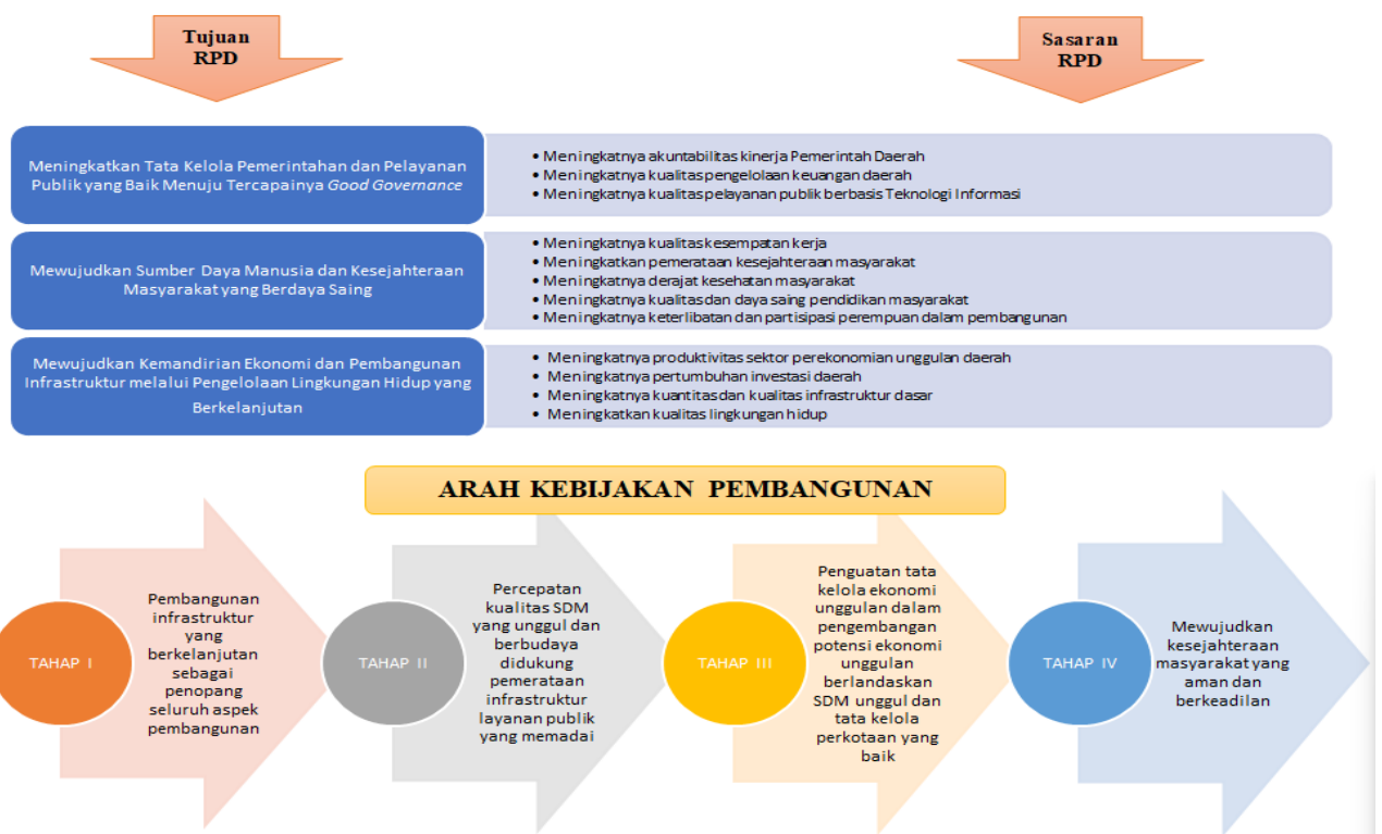
Gambar 2.20 Cascading Riset dan Inovasi Kota Pangkal Pinang